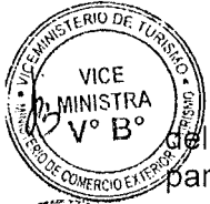
ROGERS VALENCIA ESPINOZA Ministro de Comercio Exterior y Turismo