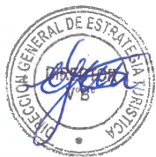
ROBERTO SÁNCHEZ PALOMINO Ministro de Comercio Exterior y Turismo