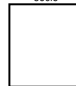
Huella dactilar del socio

_____ FIRMA (consignar firma de cada socio) NOMBRES Y APELLIDOS (Consignar nombres y apellidos completos de cada socio) DNI (consignar el número de DNI de cada socio)